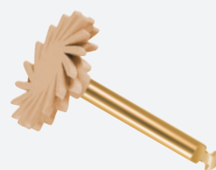
FIN POLISSAGE HAUTE BRILLANCE